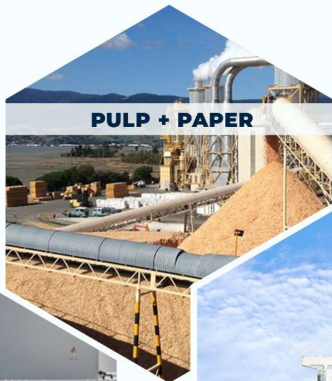
PULP + PAPER