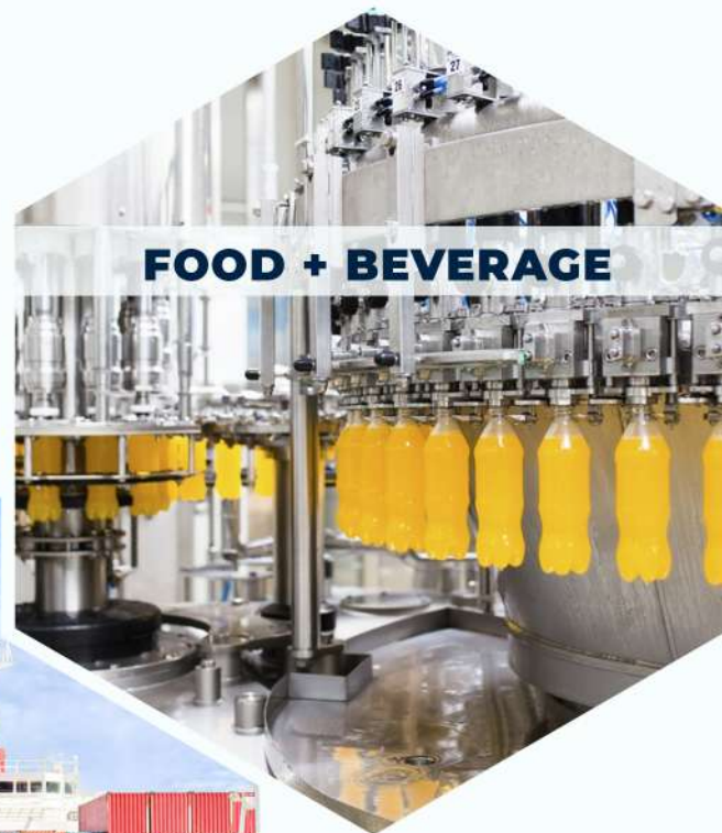
FOOD + BEVERAGE