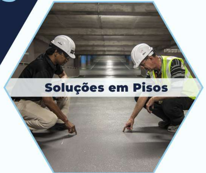
Soluções em Pisos