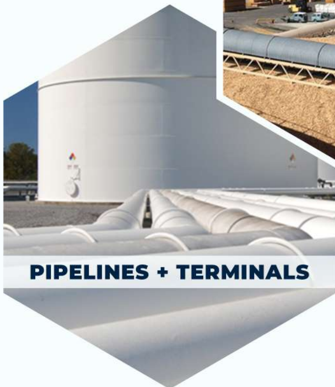
PIPELINES + TERMINALS